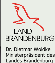
Dr. Dietmar Woidke Ministerpräsident des Landes Brandenburg